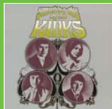
The Kinks – Something Else