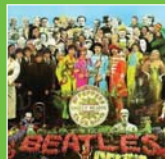
The Beatles – Sgt. Pepper's Lonely Hearts Club Band