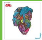
Love – Forever Changes