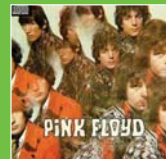
Pink Floyd – The Piper at the Gates of Dawn