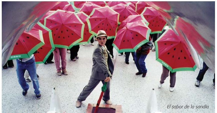
El sabor de la sandía