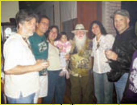
En familia, con Hermeto Pascoal